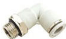
Série FL - Conexão Cotovelo