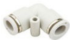
Série FL - Conexão Cotovelo Tubo - Tubo