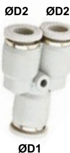
Série FRY Conexão "Y" Redução